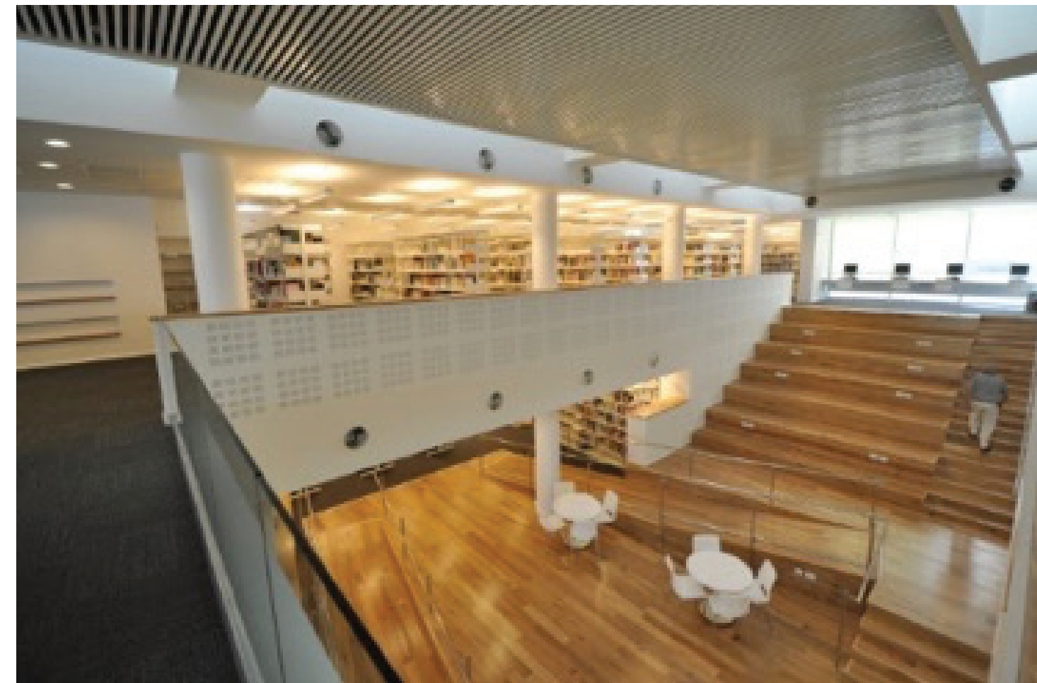
ספרייה במכללה האקדמית כנרת