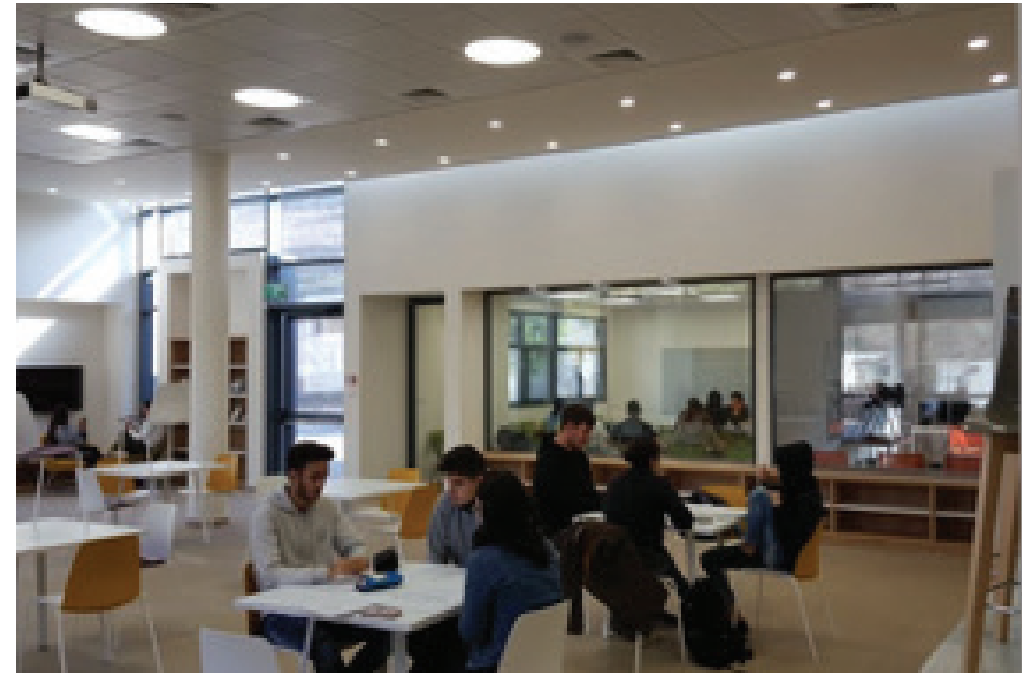
בי"ס "דנציגר" בקריית שמונה

בשני עשורים של פעילות, הקמנו 350 פרויקטים ובנינו תשתיות המהוות בסיס לפעילויות חברתיות בהיקף של 1.5 מיליארד ש"ח.